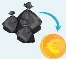
Tableau de l'augmentation annuelle de la TGAP

Cette redevance évolue en raison de l'augmentation des coûts de traitement des OM auxquels l'État applique une fiscalité de plus en plus lourde (TGAP, Taxe Générale sur les Activités Polluantes). A taux constant, la part de la TEOM qui sert à couvrir le coût de gestion des déchets ne cesse de diminuer alors que la TGAP ne cesse d'augmenter.